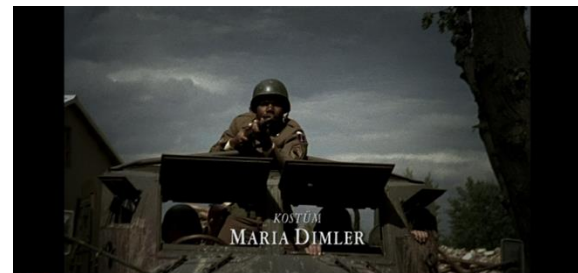
Abb. 5: Handlungs- und Blickachse sind deckungsgleich und frontal gegeneinander gerichtet: Das Fahrzeug nähert sich, ein Soldat mit angelegtem Gewehr bedroht ihn