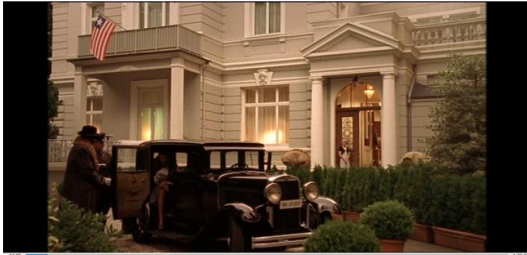
Abb. 11: Villa des liberianischen Konsuls in der Johnsallee mit der liberianischen Flagge