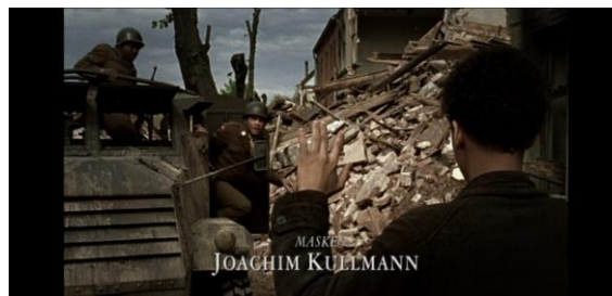
Abb. 7: Die Kamera zeigt die reale Distanz zwischen Hans-Jürgen und dem Fahrzeug