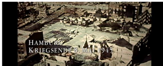
Abb. 1: Beginn des Films: Aufnahme der Trümmerlandschaft Hamburgs mit Insert vom Kriegsende in Hamburg während des Voice-overs mit der Ansprache Karl Kaufmanns

quoi 2008: 291). 16 Während des Voice-overs erscheint das Insert: „HAMBURG. KRIEGSENDE 8. MAI 1945.“ Der Film beginnt auf diese Weise mit einem markanten Ereignis aus dem Leben des Helden, das für ihn die Befreiung von der Bedrohung und Diskriminierung durch den Nationalsozialismus bedeutet.