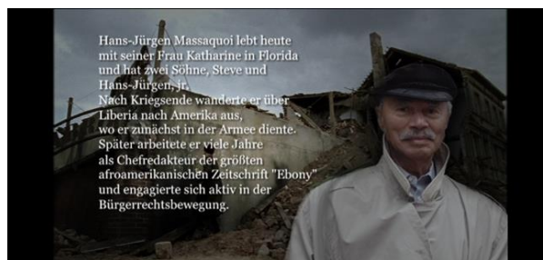
Abb. 13: Ein Foto des realen Hans-Jürgen Massaquoi und ein Insert mit Informationen über sein weiteres Leben

Auf die Referenzen des Gezeigten zur realen Person Hans-Jürgen Massaquoi und zu den historischen Geschehnissen machen nicht zuletzt ein Foto des realen Massaquoi sowie ein Insert am Ende des Films aufmerksam, in dem über seine weitere Lebensgeschichte informiert wird. 23